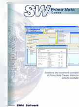
PRIMA NOTA CASSA