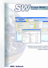
PRIMA NOTA CASSA